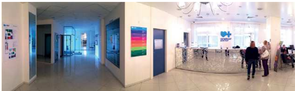
Регистратура поликлиники №9