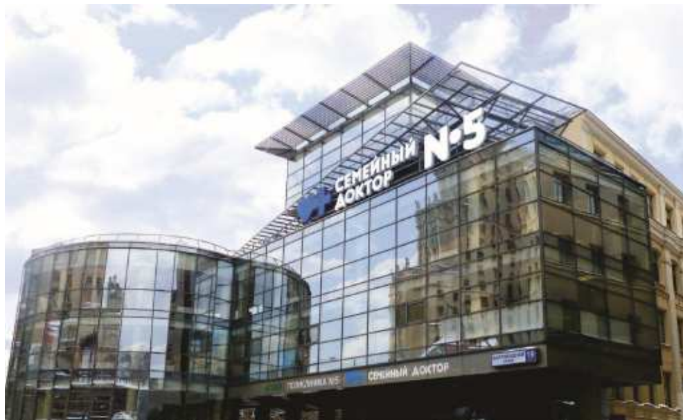
Поликлиника № 5