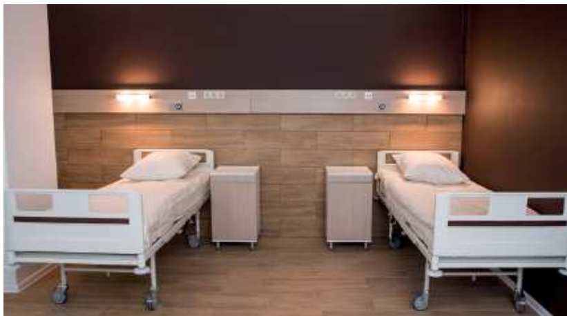
Типовая палата госпитального центра