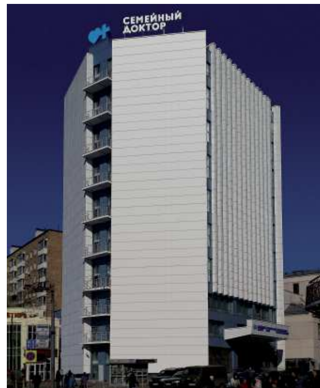
Госпитальный центр сети

Площадь поликлиники составляет 3 207 м 2 , работают 30 медицинских кабинетов. В поликлинике ведут прием 45 врачей, среди них 20 ведущих специалистов и 17 врачей высшей категории.